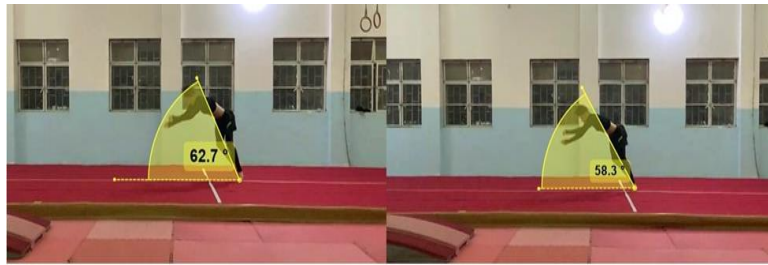
زاوية الاتصال 360° لف زاوية الاتصال 720° لف