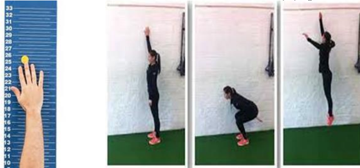
الشكل التوضيحي رقم (١) إختلاف المعدات والأجهزة المستخدمة بالوثب العمودي

بطريقة سارجينت التقليدية يقف التلميذ بجانب جسمه ملاصقاً لجدار القياس رافعاً ذراعه القريبة عالياً لأبعد نقطة. يقف بكامل قدميه على الأرض وبشكل معتدل ، يتم تحديد إرتفاع طرف الأصبع الأوسط على الجدار بالبطاشير. وهذا الوضع يطلق عليه بوضع الوقوف الأول، ثم يطلب منه بالإبتعاد قليلاً عن الجدار ثم الوثب عالياً بالإتجاه الرأسي إلى أعلى مسافة عمودية ممكنة مستخدماً كلتا ذراعيه ورجليه بالإندفاع بالجسم بأقصى قوة للأعلى لكي يضع علامة ثانية في أعلى نقطة على الجدار وهذا يطلق عليه بوضع القفز الثاني. ويمكن لتكنيك الوثب العمودي أن ينفذ إما بدون أومع حركة إنتناء مسبقة بالركبتين للأسفل قبل حركة الدفع عالياً (أنظر تكنيك الوثب العمودي). يمنح الرياضي أو المختبر ثلاث محاولات وتسجل أفضل محاولة له ، ويتم حساب الفرق بين الوضعين الأول والثاني لتسجيل الإرتفاع العمودي للوثب بالسنتيمتر وأجزائه ، الشكل التوضيحي (١).